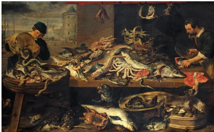
Рис. 2. Франс Снейдерс «Рыбная лавка», 1620 год. Эрмитаж.

чувствуешь запах рыбы. И вернее даже не запах, а смрад. Все проникнуто динамикой и от каждого элемента ждешь движения.