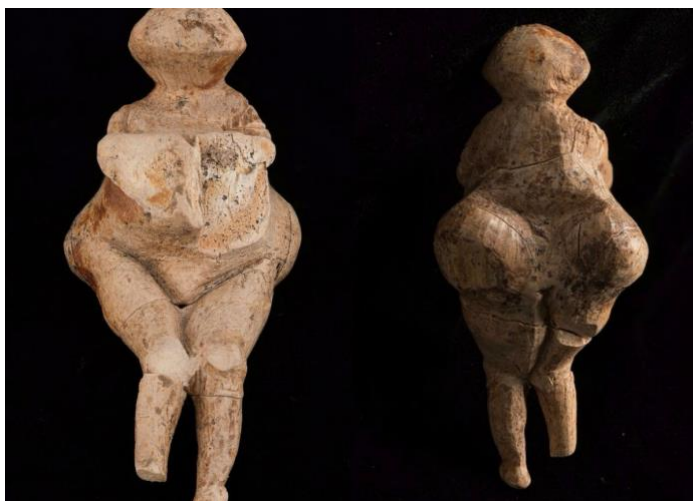
Рис. 1. Палеолитические Венеры.

С другой стороны раз уже заговорили о скульптуре – у нас есть потрясающие римские скульптурные портреты, где символизм сведен почти до нуля. Зато есть подражание действительности. И если внимательно взглядеться в эти лица они словно живые.