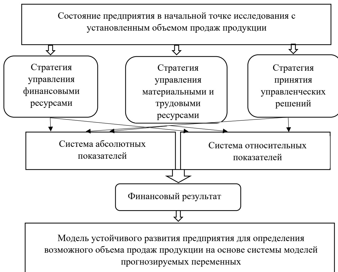
Рисунок 1 – Система устойчивого экономического развития предприятия.

1. Стратегия управления финансовыми ресурсами для поддержки устойчивого экономического развития.