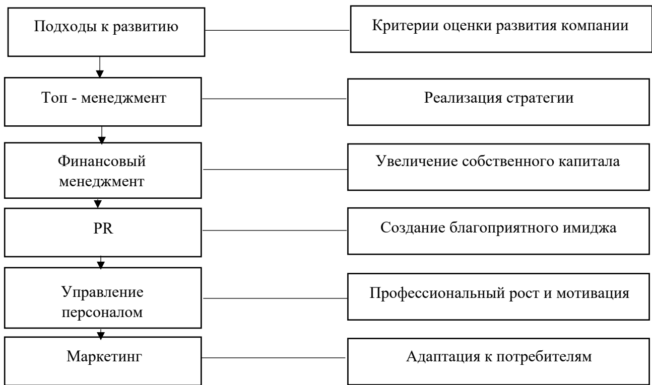
Рисунок 3 – Разноуровневый подход к оценке процессов организационного развития.

Поддержка экономической устойчивости в виде развития, отображает совокупность средств организационного, технического и методического характера, нацеленных на проявление а также устранение вероятной опасности устойчивому процессу развития организации, к тому же, еще и сопротивление имеющимся и возможным отрицательным моментам. Обычно, под устойчивостью во взгляде экономики, систематизируют в качестве устойчивости финансирования, валютной устойчивости, устойчивость денежных отношений.