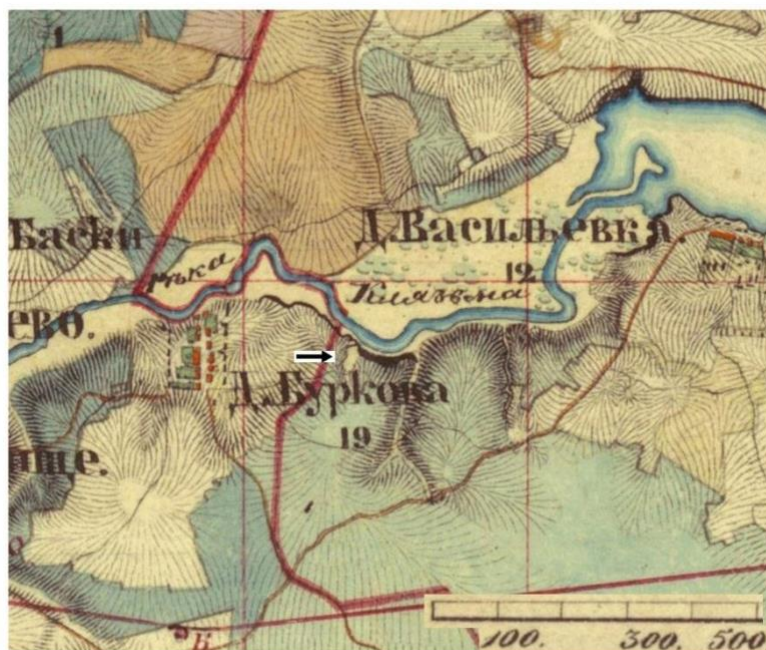
Военная съемка Московской губернии. Масштаб 1 верста (500 сажен) в дюйме. 1852 и 1853 годов. 135 листов // РГВИА. Ф. 386. Оп. 1, ч. 3. Ед. хр. 3657. Ч. 1-2. Фрагмент соответствующий территории пос. Загорянка с указанием поляны на месте средневекового поселения (показано стрелкой)

В вышеуказанном месте, в районе домовладений по адресу пос. Загорянский, ул. Клубничная до настоящего времени сохраняются следы лесной поляны, показанной на карте 1852 – 1853 гг. В ходе обработки участков