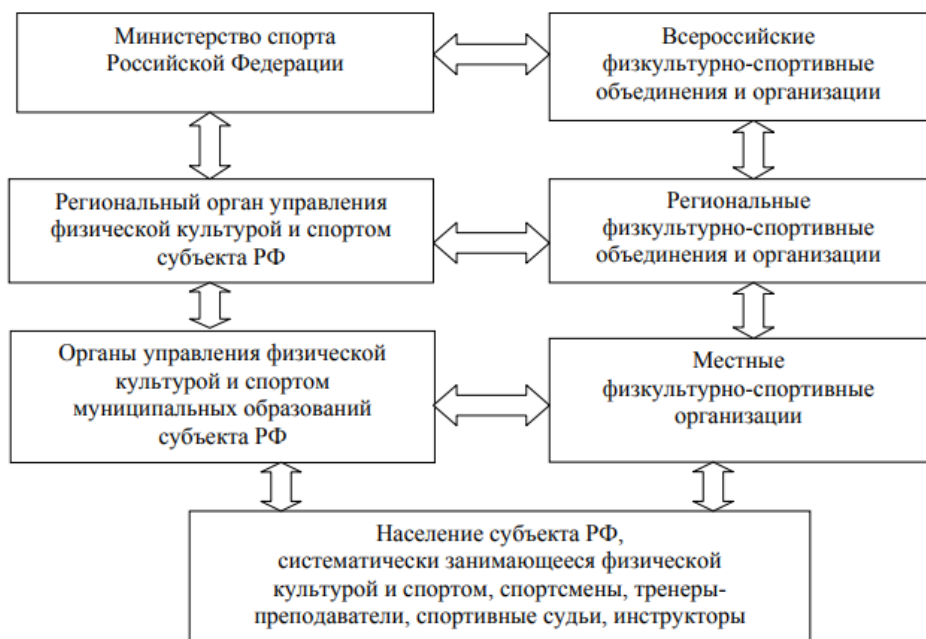
Рисунок 1 – Структура взаимосвязи государственных органов и общественных организаций и объединений в Российской Федерации на различных уровнях управления

Управления по делам молодежи и спорта в городе Севастополе является исполнительным органом государственной власти города Севастополя, которая осуществляет в пределах своих непосредственных полномочий управление в сфере молодежной политики, физической культуры и спорта.